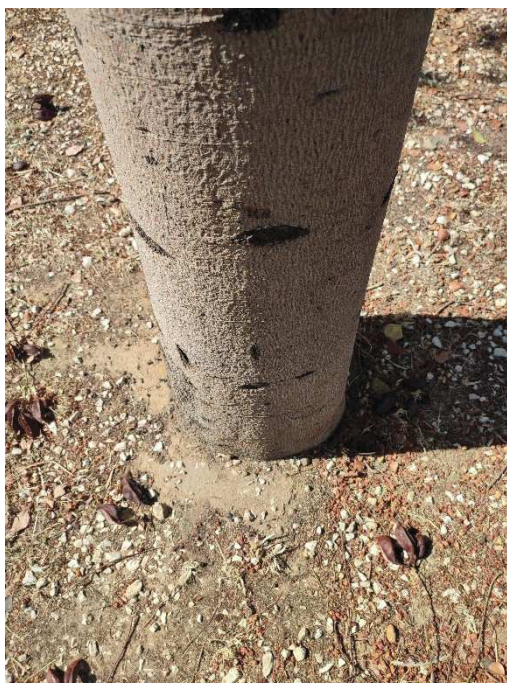
Imágenes del ejemplar con id 123