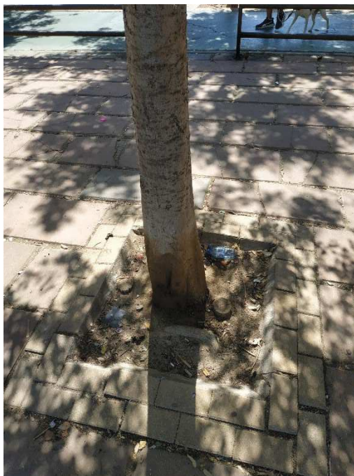
Imágenes del ejemplar con id 119