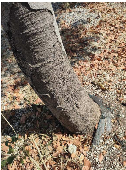
Imágenes del ejemplar con id 102