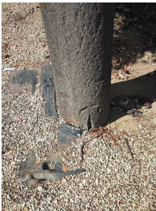
Imágenes del ejemplar con id 82