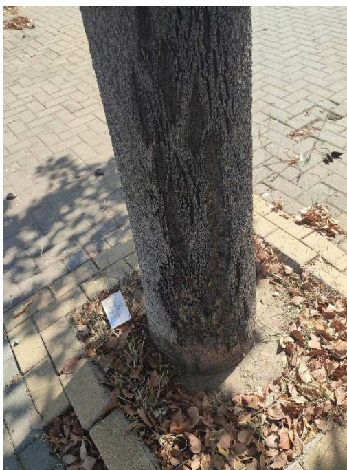
Imágenes del ejemplar con id 71