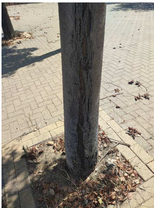
Imágenes del ejemplar con id 67