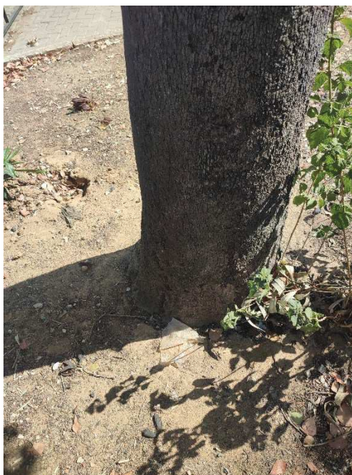
Imágenes del ejemplar con id 62