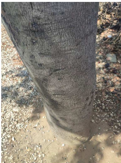
Imágenes del ejemplar con id 51