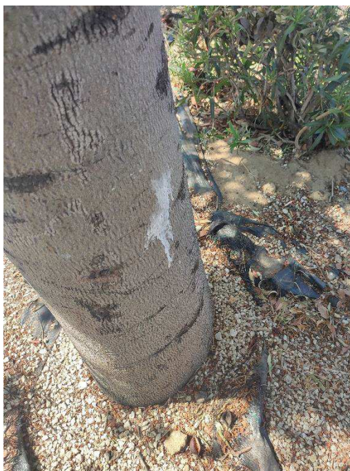
Imágenes del ejemplar con id 123187