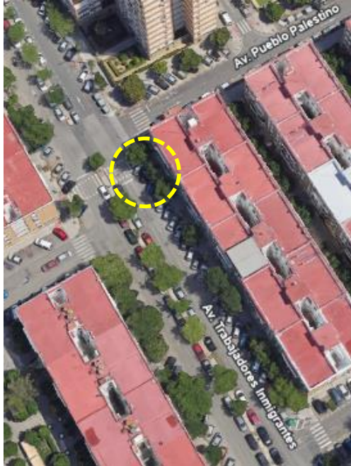
Localización: Styphnolobium japonicum con ID 100 en la Avenida Trabajadores Inmigrantes