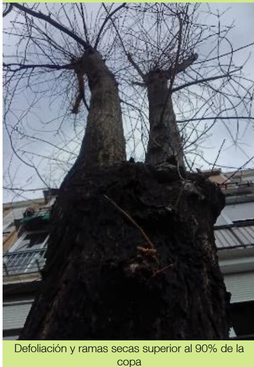
Defoliación y ramas secas superior al 90% de la copa