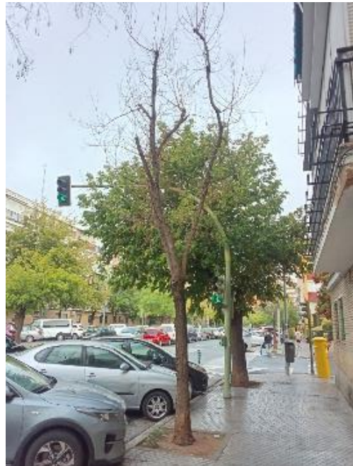
Vista general: árbol seco.