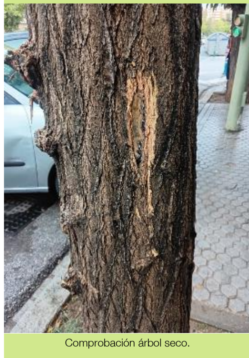
Comprobación árbol seco.

Ayuntamiento de Sevilla Plaza Nueva, 1 41001 Sevilla +34 955 010 010 www.sevilla.org