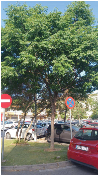
Vista general: Ejemplar con riesgo no tolerable

Localización: ID 7829, CALLE CIUDAD DE PATERNA, distrito Este-Alcosa-Torreblanca