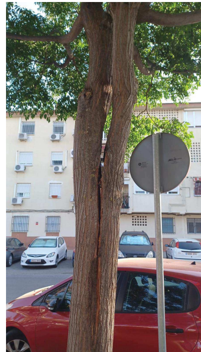
Vista fallo: Grieta eje principal