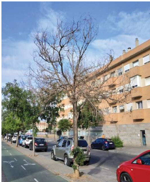
Vista general del ejemplar con id 44030, completamente seco