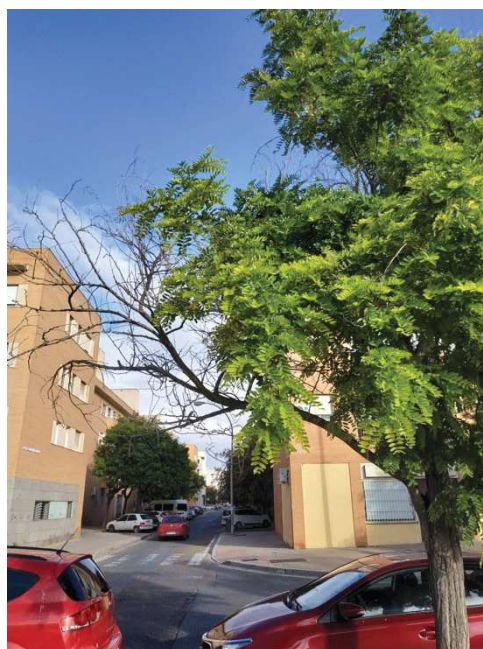
Fisuras y descortezado longitudinal en copa. Rama seca