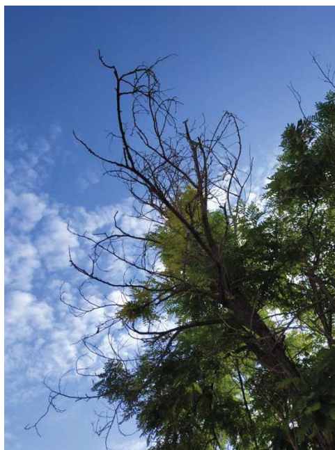
Vista general del ejemplar con id 44029, copa alterada, parcialmente seca