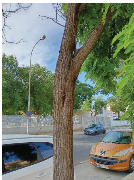
Detalle de cavidad cerrada