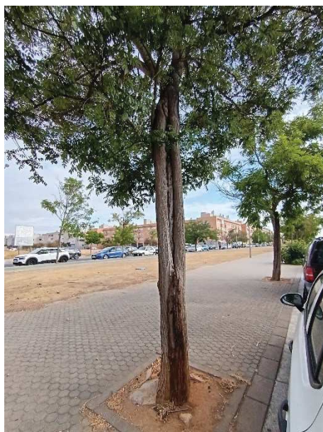
Herida longitudinal en tronco con duramen visible