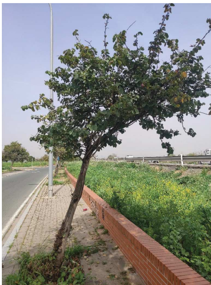
Vista general del ejemplar con ID 116992