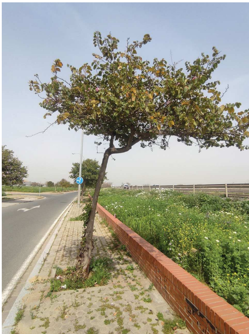
Vista general del ejemplar Id 116959