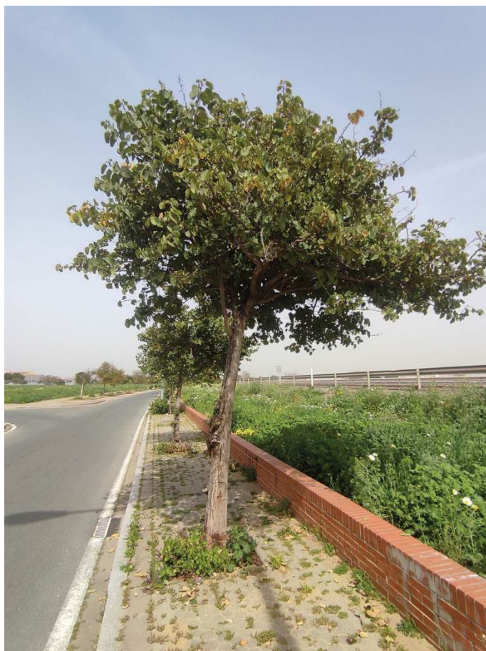
Vista general ejemplar id 116965