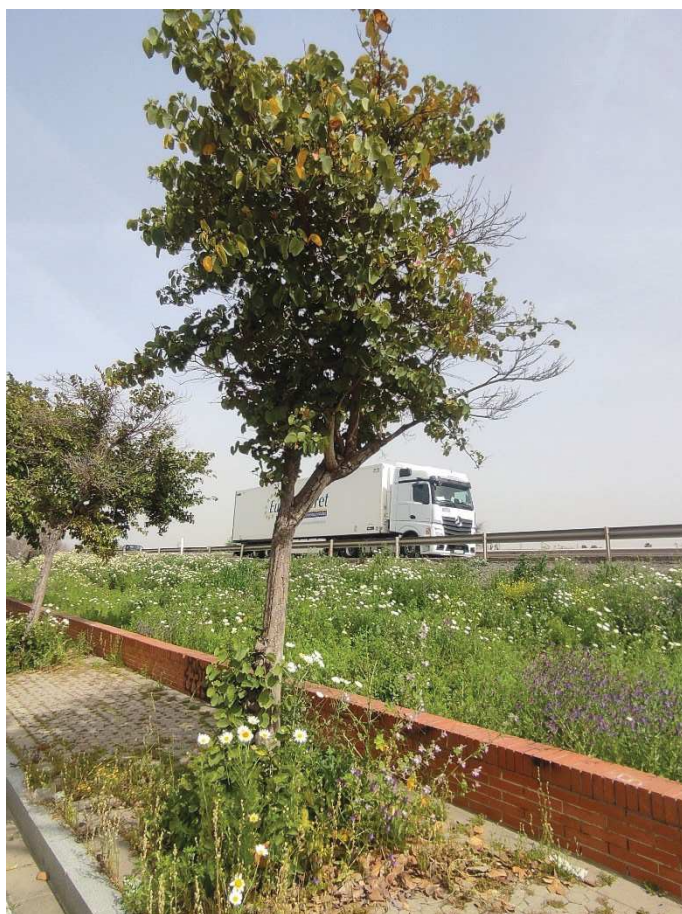
Vista general del ejemplar con ID 116968