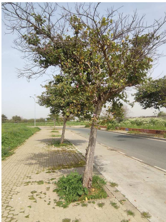
Vista general del ejemplar Id 117019