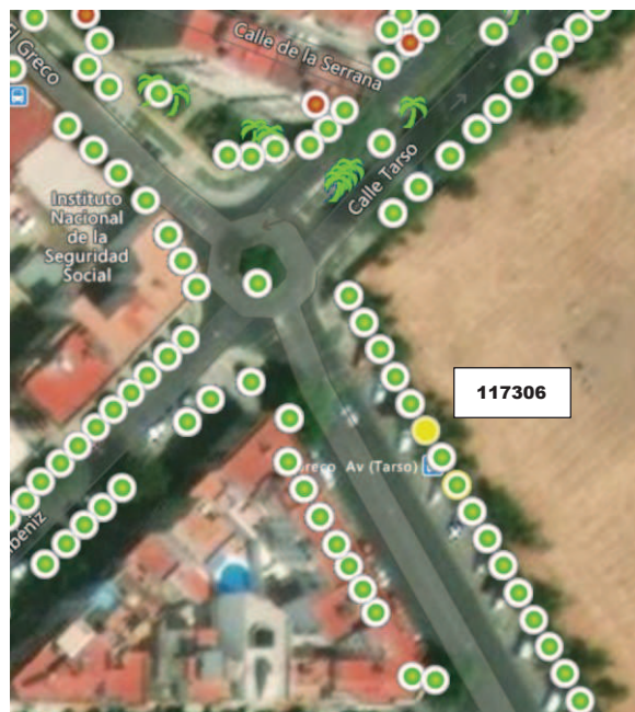
Localización del ejemplar en color amarillo