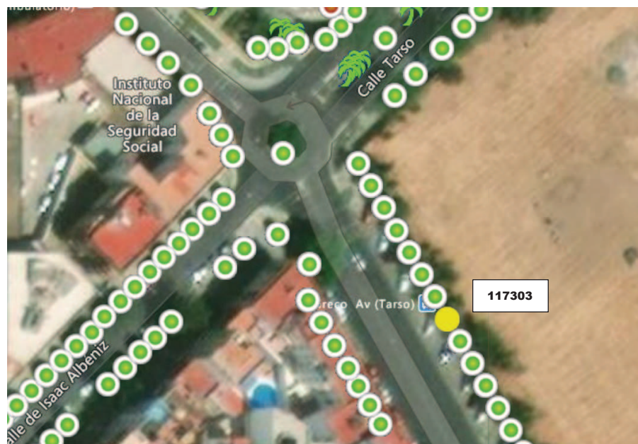
Localización del ejemplar en color amarillo