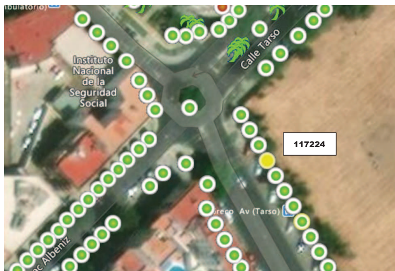
Localización del ejemplar en color amarillo