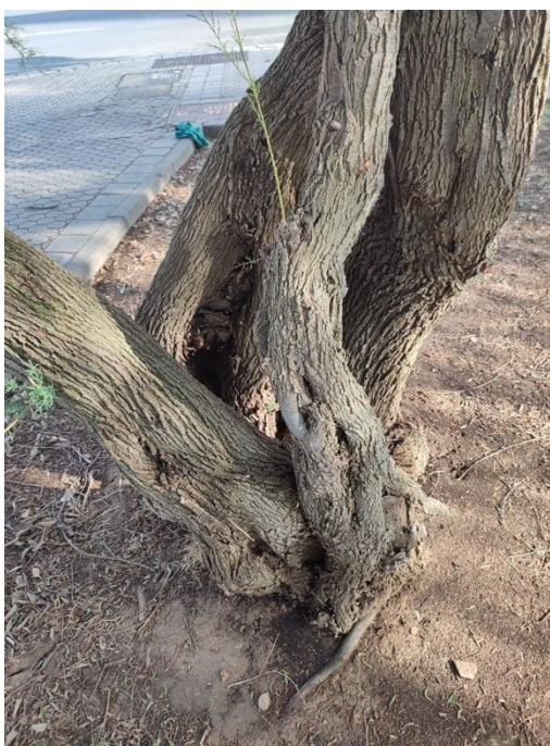
Imágenes del ejemplar con id 127933