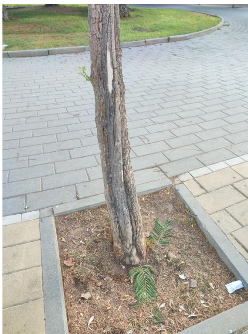
Imágenes del ejemplar con id 40492