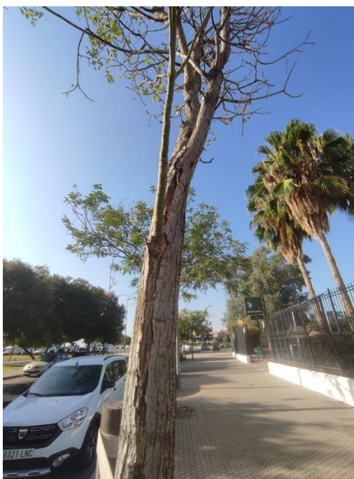
Imágenes del ejemplar con id 111135