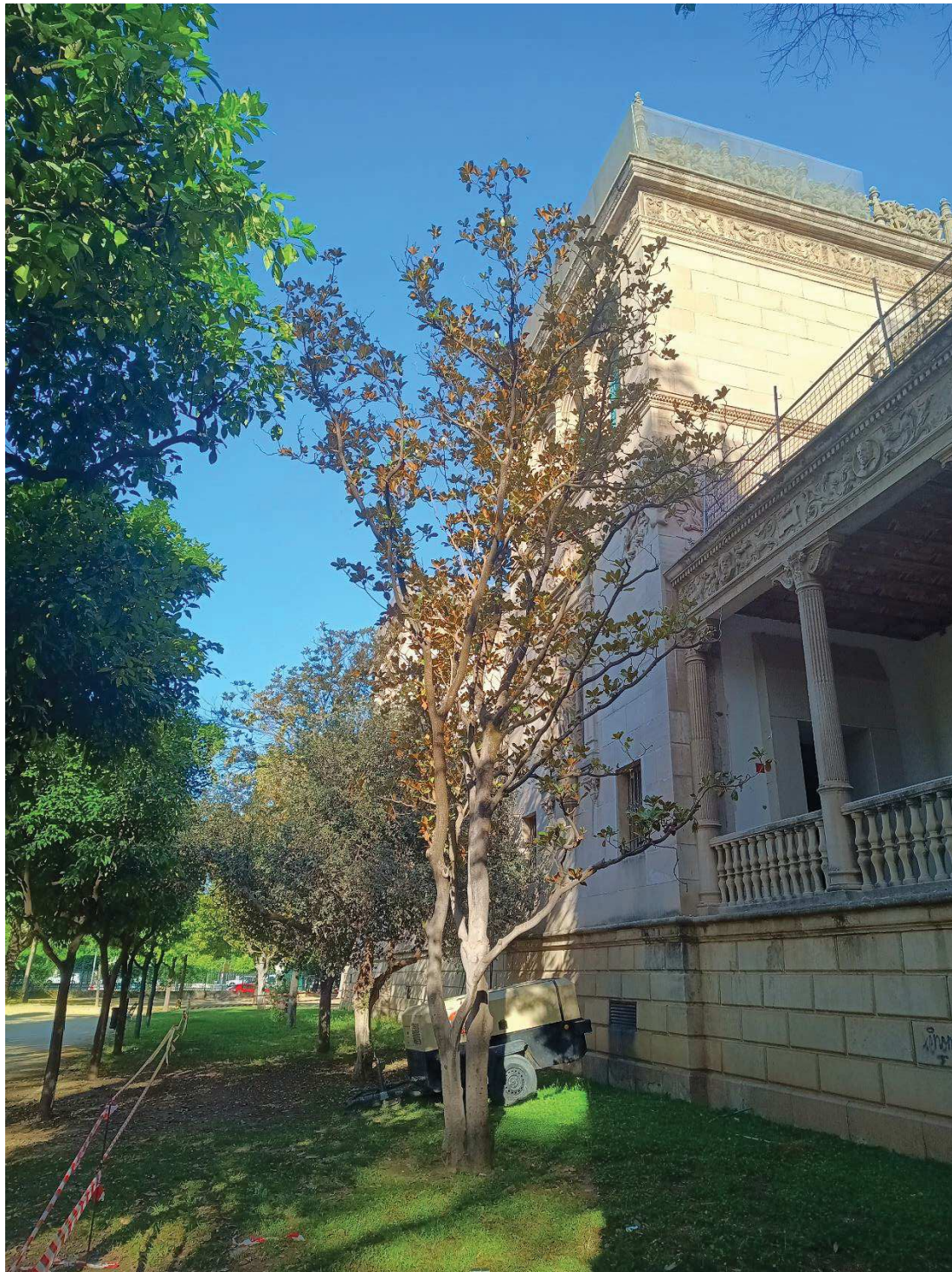
Vista general del ejemplar.