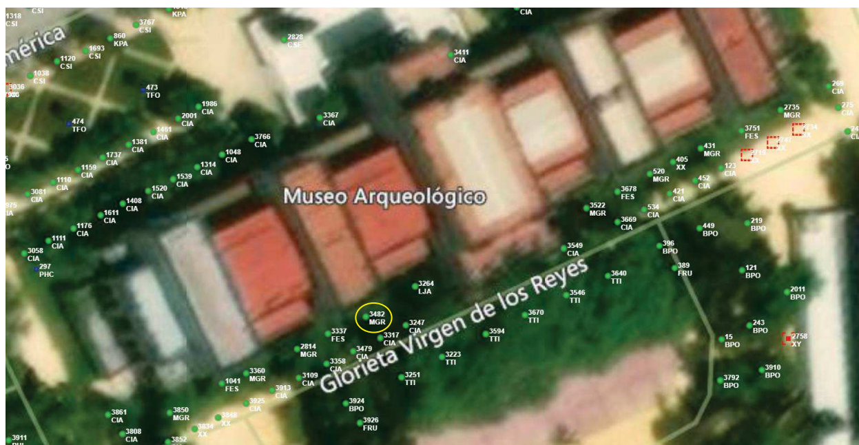
Localización del árbol marcado en amarillo.