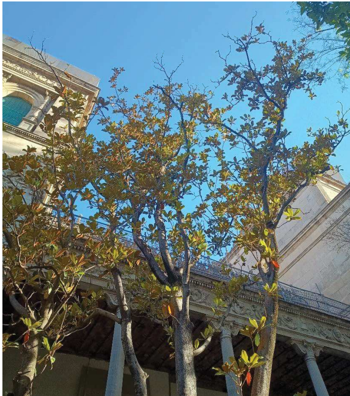
Síntomas de desvitalización en copa.