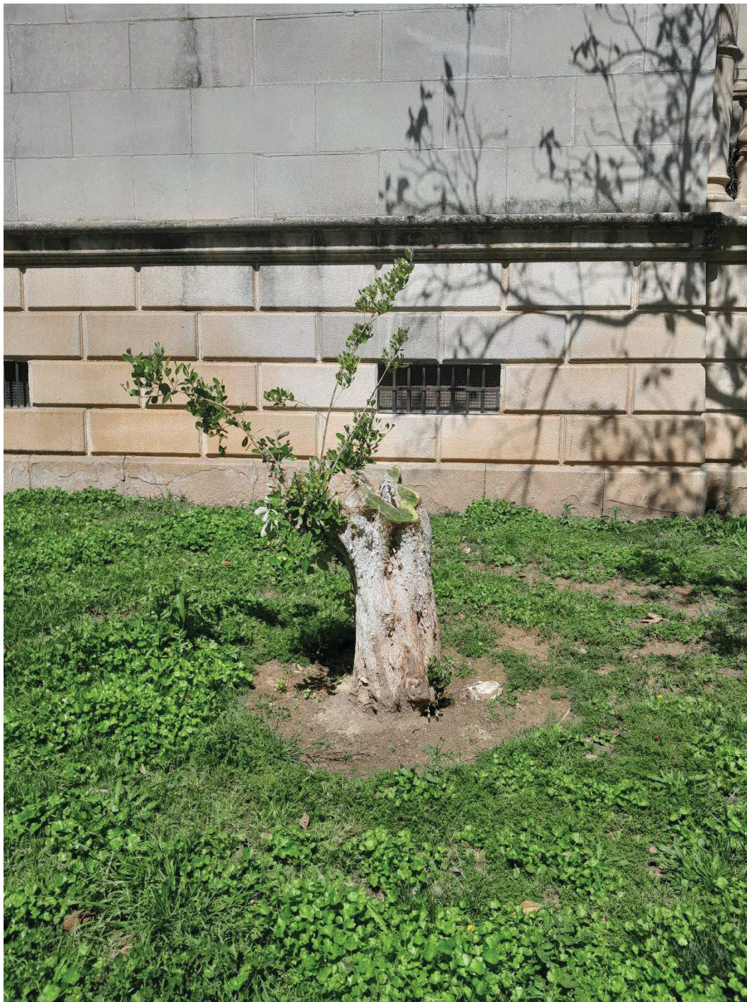
Vista general del ejemplar.