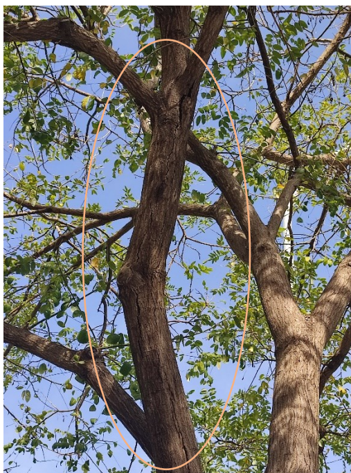
Imágenes del ejemplar con id 239