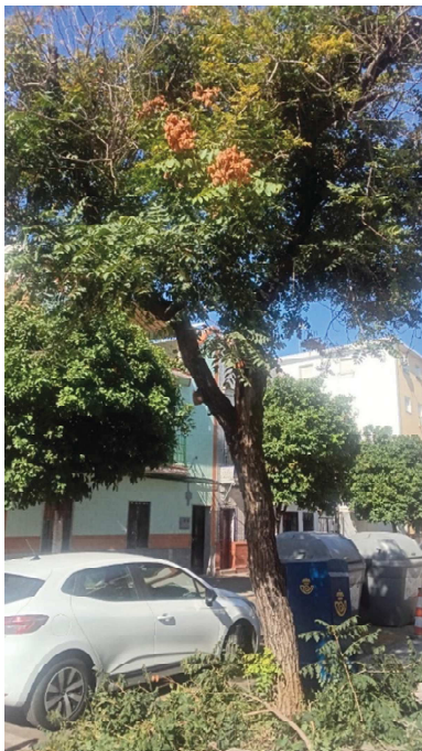
Vista general: árbol de alineación desvitalizado en alcorque sobre pavimento, en zona de alta concurrencia.