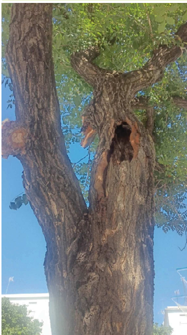
Pudrición que afecta a toda la estructura del árbol y que crea cavidad en la base de las primarias, cruz y parte superior del tronco. A la izquierda cavidad abierta en una de las primarias y a la derecha corte transversal de secundaria y base del tronco con diversos grados de pudrición.