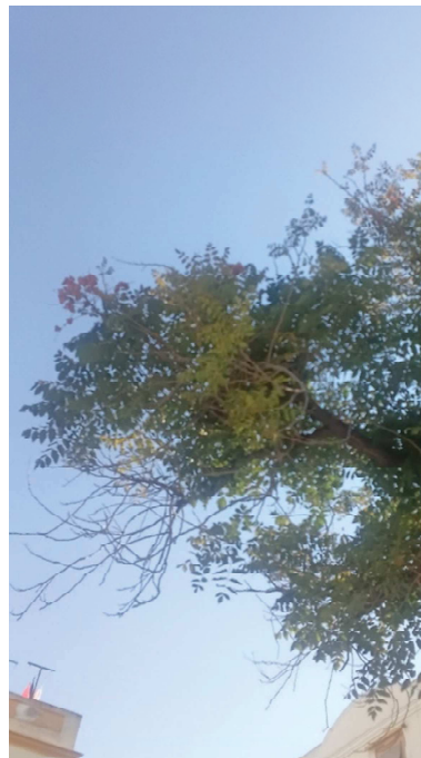
Desvitalización: amarilleamiento y defoliación en un 10% de la copa