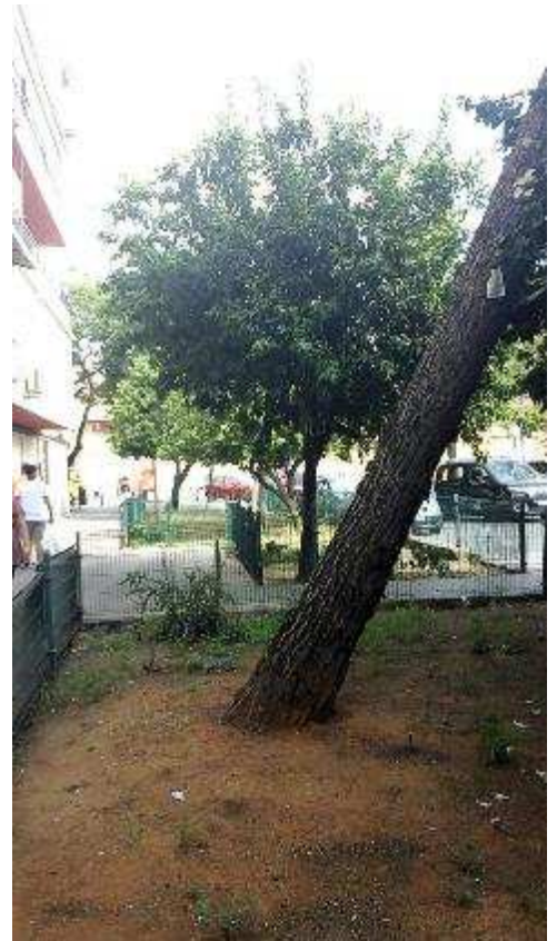
Detalle inclinación actual de unos 45°. No se aprecian señales evidentes de levantamiento de la plataforma radicular.