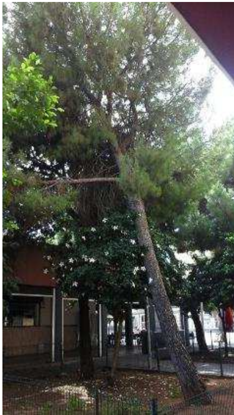
Vista general. Diana por paso peatonal y locales comerciales. Inclinación en copa no corregida.