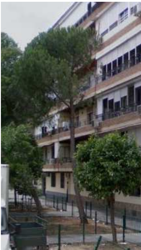
Inclinación activa desde mayo del 2008 a abril del 2017, haciendo cada vez más acusada en los últimos años.