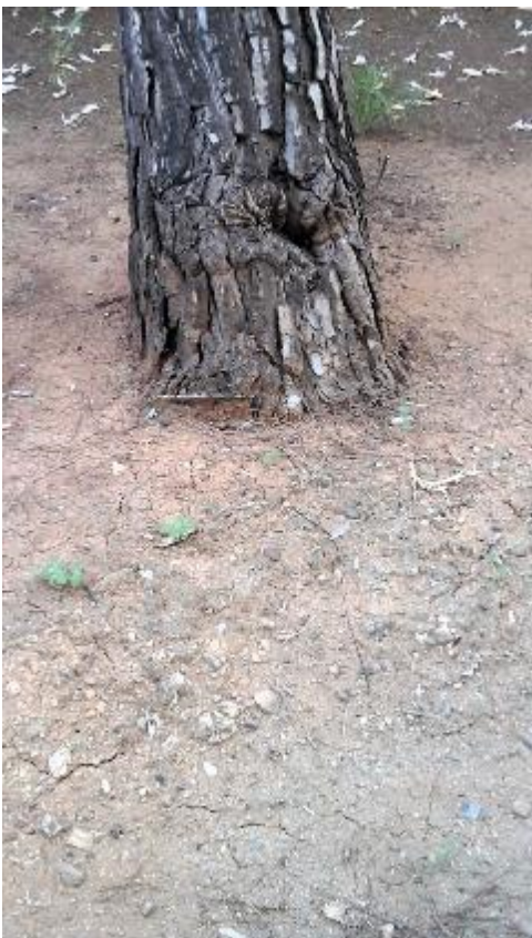
Herida en la base del tronco y ligero levantamiento de la plataforma radicular a tensión con grietas irregulares.