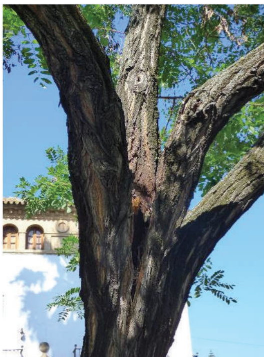
Detalle de codominancia y corteza incluida con necrosis central