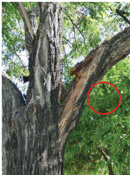
Detalle del desgarró (círculo rojo)